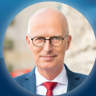
Erster Bürgermeister Peter Tschentscher

Schirmherr des 2. Nationalen Wirtschaftsforums Wasserstoff